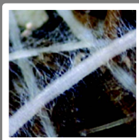
Kieming en wortelontwikkeling